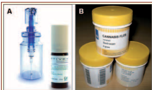
2. ábra: A Sativex és adagolója (A; forrás: www.packworld.com ), valamint a gyógyszerminőségű virágzatot tartalmazó Bedrocan (B; forrás: www.mspotilas.wordpress.com )

gelést és egyedi felírást szabták meg a hatóságok 3 . Mintegy tíz éve Hollandia kormánya úgy döntött, hogy „más államokban tapasztalt hiányosságok kiküszöbölésére” központosított kannabisz ellátást valósít meg a gyógyszerárak segítségével. A program megszervezését, bonyolítását és ellenőrzését egy központi hivatalra bízta a kormány. A növény természetével egyetlen céget bíztak meg, amely ellenőrzött feltételek között két THC-ben és egy CBD-ben gazdag típusról gyűjti a gyógyszer minőségű, ellenőrzött hatóanyagtartalmú virágzatot. Előbbiek Bedrocan-nak (kb. 18% THC és 0,8% CBD), illetve Bedrobinol-nak (13% THC és kb. 0,2% CBD), a CBD-ben gazdag típust pedig Bediol-nak (kb. 5% THC és maximálisan 6% CBD) nevezik (2. ábra). A THC-ben gazdag típusokat szárított droggként kb. 5 grammos csomagolásban forgalmazzák, a CBD típust viszont granulátum formájában [3, 13]. A program keretében forgalmazott kannabisz termékek szakszerű megalapozására a Hivatal az Európai Unión belül 9 kutató és terápiás intézmény bevonásával szervezett preklinikai, 8 klinikán humán, és tucatnyi intézmény, illetve vállalat részvételével fejlesztő munkát [12].